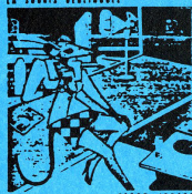
LA SOURIS DÉGÉNÉRANTS

TELE (1) 4 22 9 6 9 2 4 33, RUE DAUTAN COURT 75017 PARIS